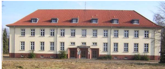
Unteroffizierkameradschaft Lingen e. V. (UK-Lingen e. V.)

Zu allen Veranstaltungen sind die Partner der Mitglieder eingeladen.